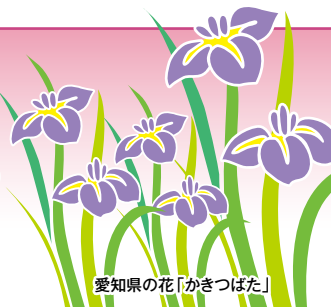
愛知県の花「かきつばた」

発行所：(公社)愛知県防犯協会連合会 名古屋市昭和区円上町26番15号 (愛知県高辻センター 2階) (052) 871-2110